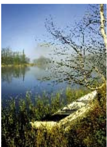
Disen ligger lett over fjellvannet og skaper en litt trolsk stemning.