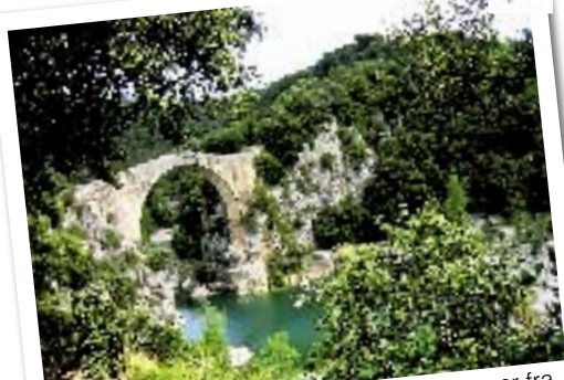
En gammel, elegant stenbru fører oss over fra den ene til den andre siden av elva.

Hest og rytter er nå blitt et team, og vi føler oss som cowboyer.