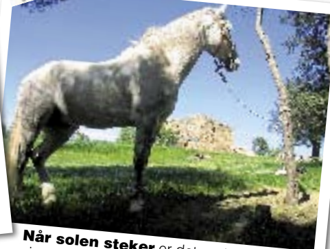
Når solen steker er det godt med en siesta i skyggen både for rytter og hest.