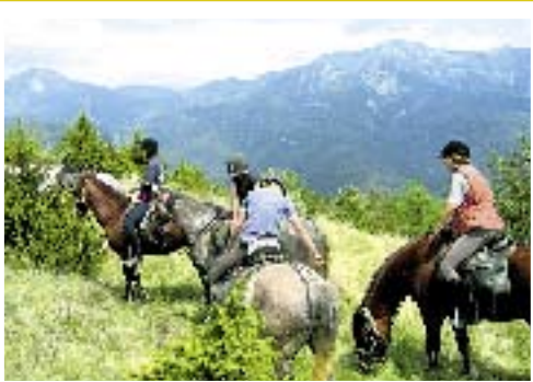
Pyreneene er majestetiske med topper på over 3000 meter.